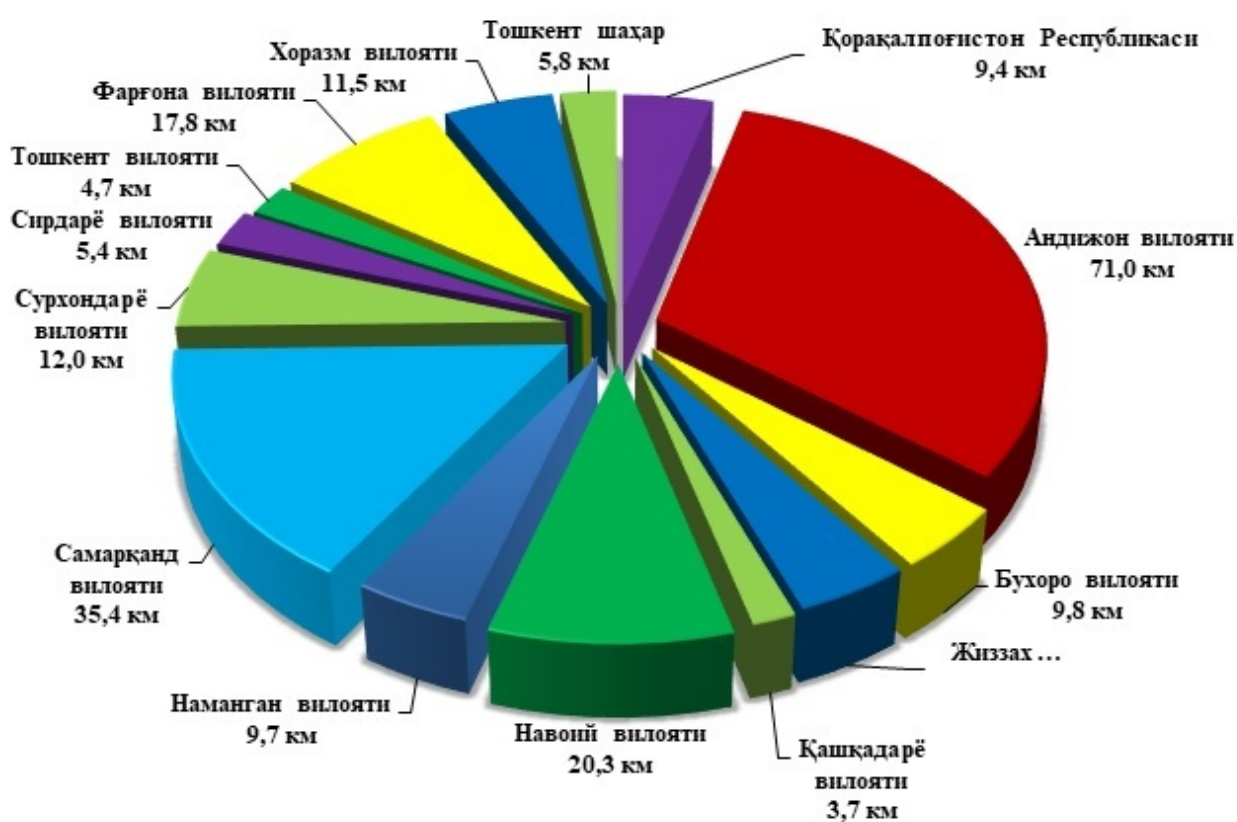
2019 йил I-чорак якунига кўра минтақавий автомобиль йўллари таъмирлаш (худудлар кесимидаги диаграмма)

2019 йил I-чорак давомида Республика бўйича автомобиль йўлларида 42695 км узунликдаги йўллардан 317,2 кмдан иборат қисмида жорий таъмирлаш ишлари амалга оширилиб, уларнинг ҳолати яхшиланди. Бу эса 2018 йилига қараганда 91,4 фоизни ташкил этади.