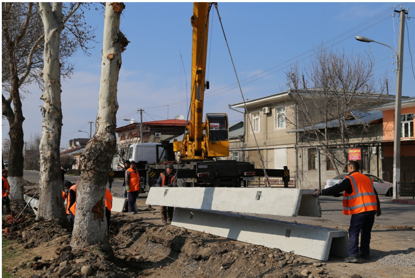
На фото отражены ремонты столичных улиц.